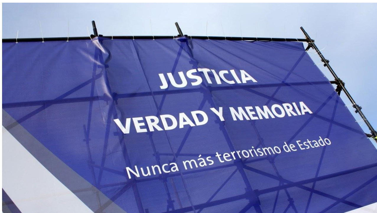
Justicia, Verdad y Memoria. Nunca más terrorismo de Estado Espacio Memorial Penal de Libertad, Ruta 1, km. 52.500, intersección con la Ruta 89, Departamento de San José, Uruguay. Acto de inauguración, 15/05/2018.

Eti: #presopoliticos #memoria #verdad #justicia #reparacion #Uruguay