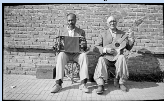
CdF. Foto de Archivo Ayestarán

que una gota con ser poco con otra se hace aguacero.